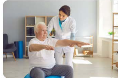
Temática 3 envejecimiento de la población