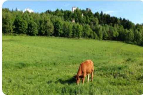
Temática 2 recursos y cadenas agrícolas/forestales