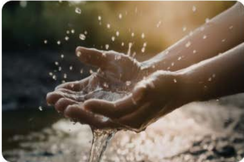
Temática 1 gestión de los recursos hídricos